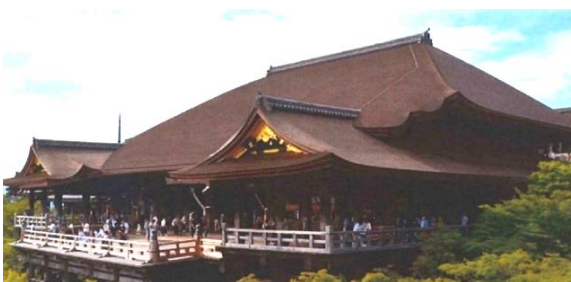
檜皮葺の清水寺本堂の屋根